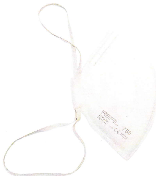
REFIL 750 FFP3 NR

Filtrační polomaska proti částicím REFIL 750 FFP3 NR a odvozená varianta s ventilkem REFIL 751 FFP3 NR slouží k ochraně dýchacích orgánů uživatele proti pevným a kapalným aerosolům podle návodu výrobce.