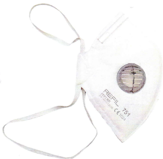
REFIL 751 FFP3 NR